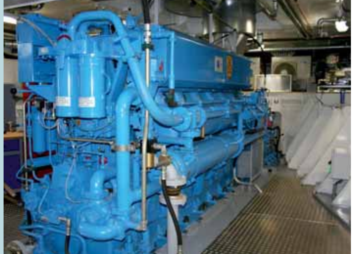
Auf Herstellerfarbgebung nimmt die MTS keine Rücksicht: Auch die 1.326 kW starke ABC-Hauptmaschine wurde in blau bestellt

Auf der MAINTAL finden zwei Schraubenspindelpumpen von EPS Verwendung, die jeweils 400 cbm/h umschlagen können. Damit sollen nach dem Löschvorgang lediglich Tankreste von 120 ccm in den neun Tanksektionen übrig bleiben. „Rohrleitungssystem und Pumpen sind so ausgelegt, dass zwei verschiedene Ladungen nicht nur unabhängig voneinander transportiert, sondern auch gleichzeitig gelöscht werden können“, erklärte Projektleiter Rudi Bauer. „Allerdings nur, wenn die Landanlage das technisch mitmacht.“ Für die Transportsicherheit sorgt neben der Doppelhülle auch eine Sprengelanlage, die bei zu großer Sonneneinstrahlung das Deck kühlen soll. Für den Ernstfall steht bei zu hohem Druckanstieg außerdem ein Überdruckventil bereit. Damit die Gase dann nicht in die Wohnungen gelangen, werden diese über die Klima- und Belüftungsanlage mit leichtem Überdruck gefahren. Die Maschinenräume sind mit einer Feuerlöschanlage ausgerüstet.