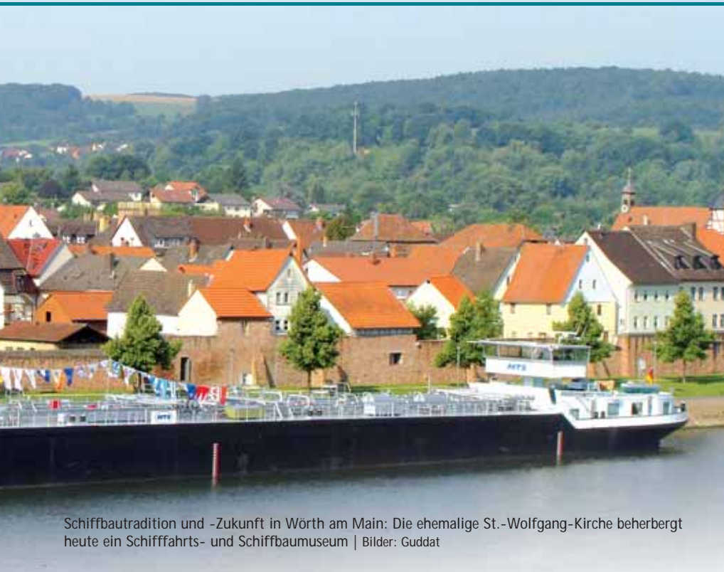
Schiffbautradition und -Zukunft in Wörth am Main: Die ehemalige St.-Wolfgang-Kirche beherbergt heute ein Schifffahrts- und Schiffbaumuseum

konnte, waren rund 80.000 Arbeitsstunden auf zwei Werften nötig gewesen.