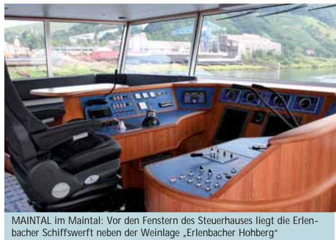
MAINTAL im Maintal: Vor den Fenstern des Steuerhauses liegt die Erlenbacher Schiffswerft neben der Weinlage „Erlenbacher Hohberg“